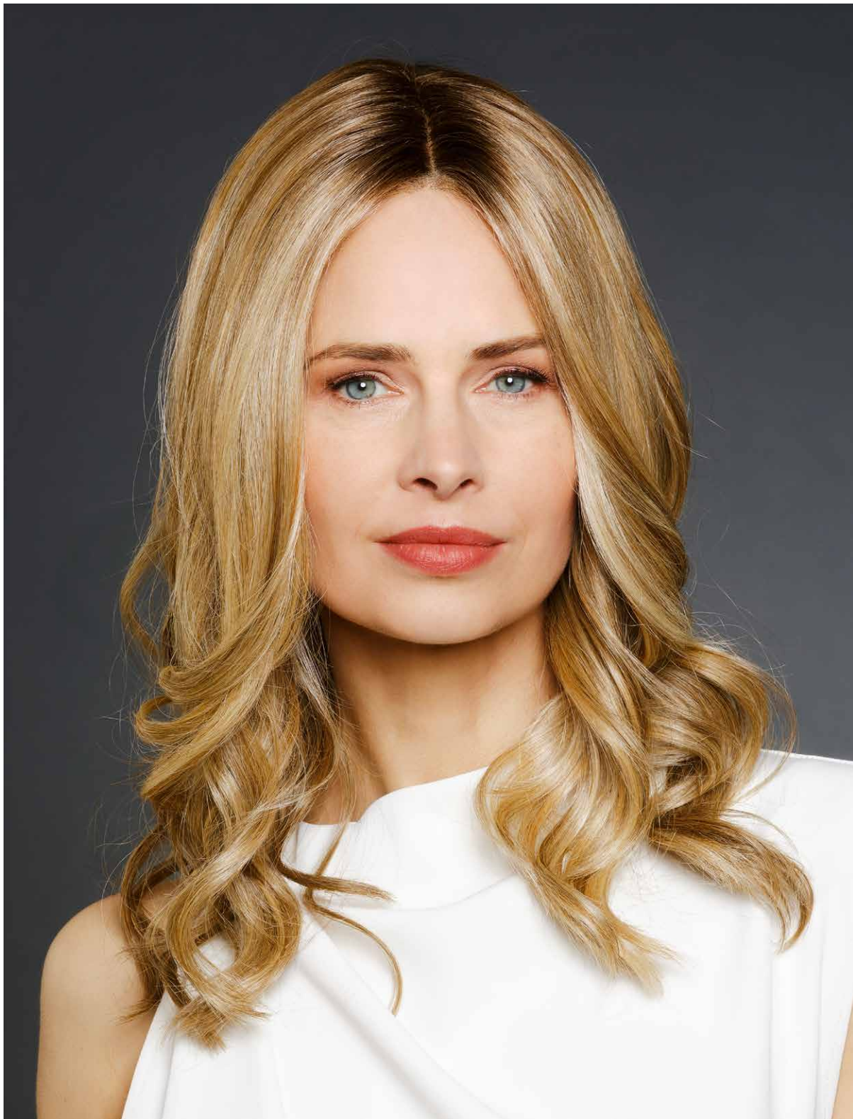
DELIA HI SF Vanilla-Mix-Root