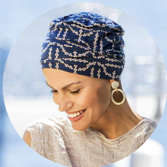
STYLE 911-80 Ketten-Print