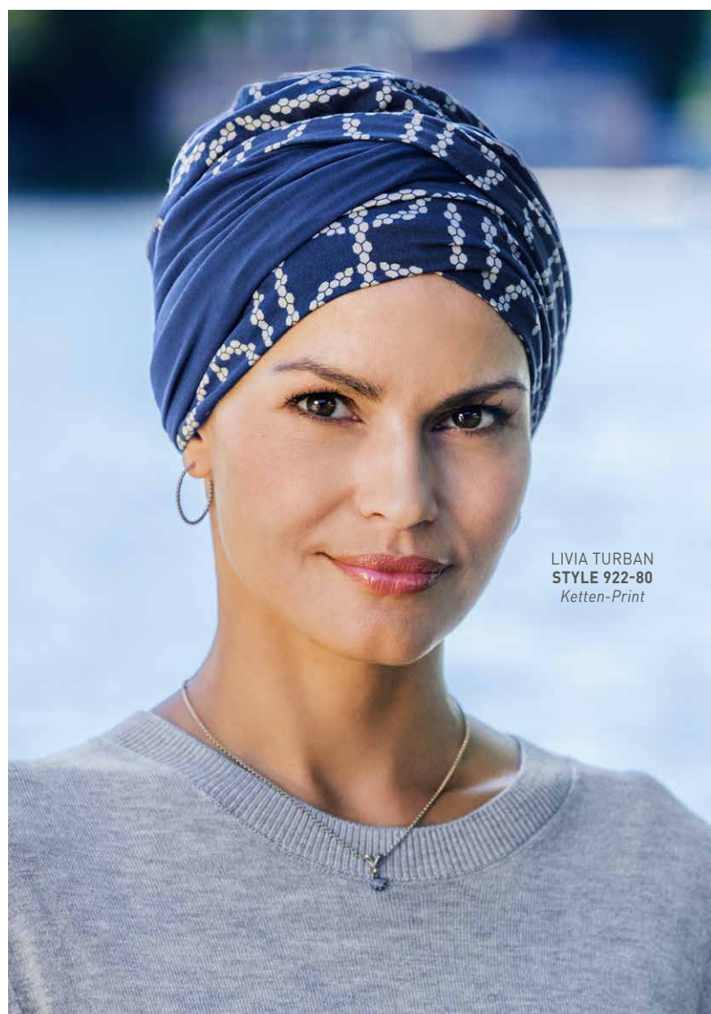
LIVIA TURBAN STYLE 922-80 Ketten-Print

ist er in drei aufregenden neuen Prints erhältlich. ■