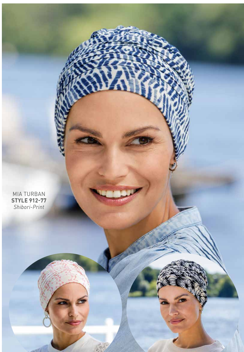
MIA TURBAN STYLE 912-77 Shibori-Print