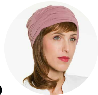
LUXURY CAP HAIR mit Pony

Das Haarband, an dem die Haare befestigt sind, passt sich dank seiner seitlichen Stretcheinsätze an jede Kopfgröße an. Durch die weiche Oberfläche ist es zudem angenehm auf der Kopfhaut zu tragen. Ein sicherer und optimaler Sitz sowie ein angenehmes Tragegefühl sind so garantiert und sorgen für ein maximales Wohlbefinden. ■