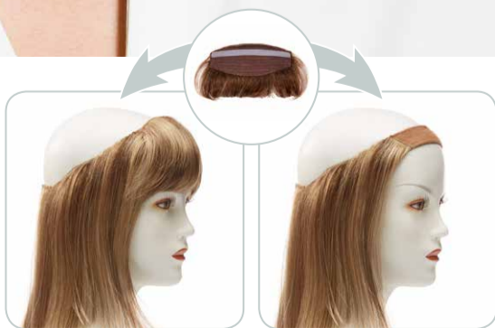
LUXURY CAP HAIR mit abnehmbarem Pony