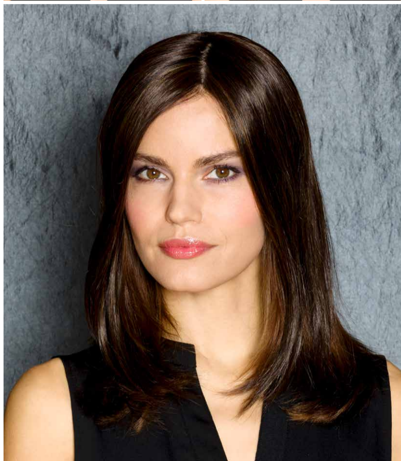
THE TOP PIECE Mocca-Mix