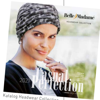
Katalog Headwear Collection

Ein wunderschönes warmes Rot ergänzt zusätzlich die Bambus-Kollektion. TURBAN STYLE 910 sowie KOPFTUCH STYLE 920 sind in dieser neuen Farbe erhältlich. ■