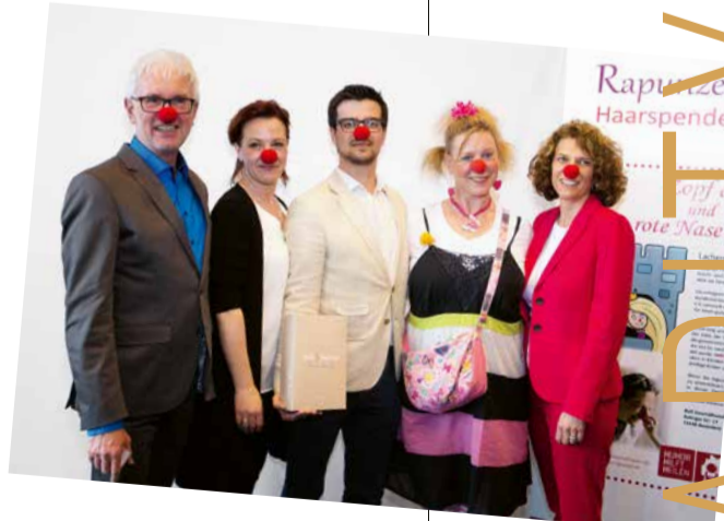
Der Erlös der gespendeten Haare geht an die Stiftung Humor hilft Heilen. Das wunderbare Echthaar wurde auch dieses Jahr von Dening Hair ersteigert.