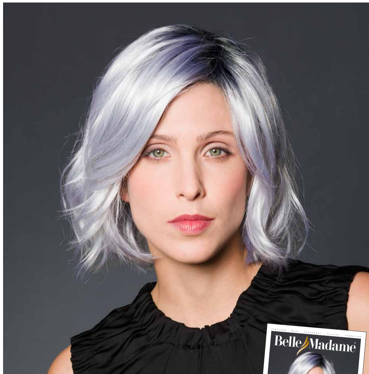
ISABELLA MONO SF+ Pastel-White & Black-Blue-Root