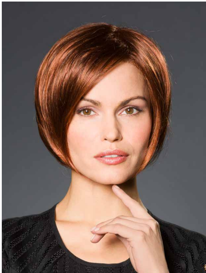
PANDORA MONO SF+ Rusty-Red