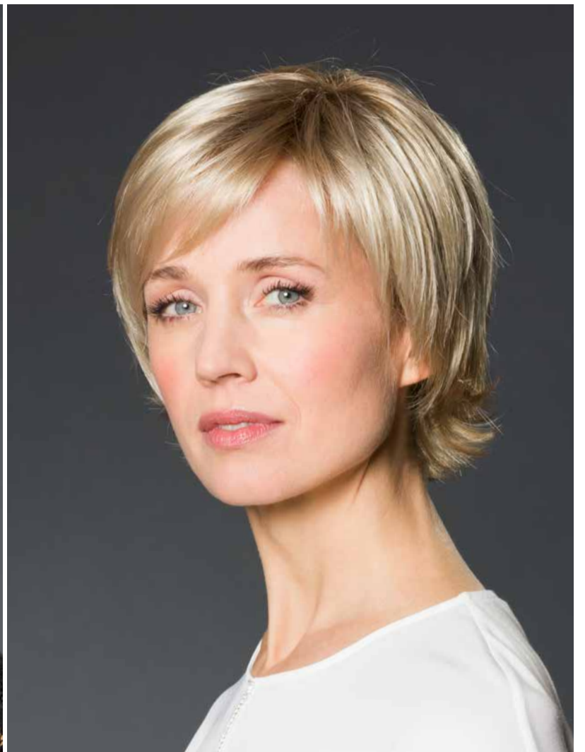
TILDA SOFT SF Nordic-Ash-Blond