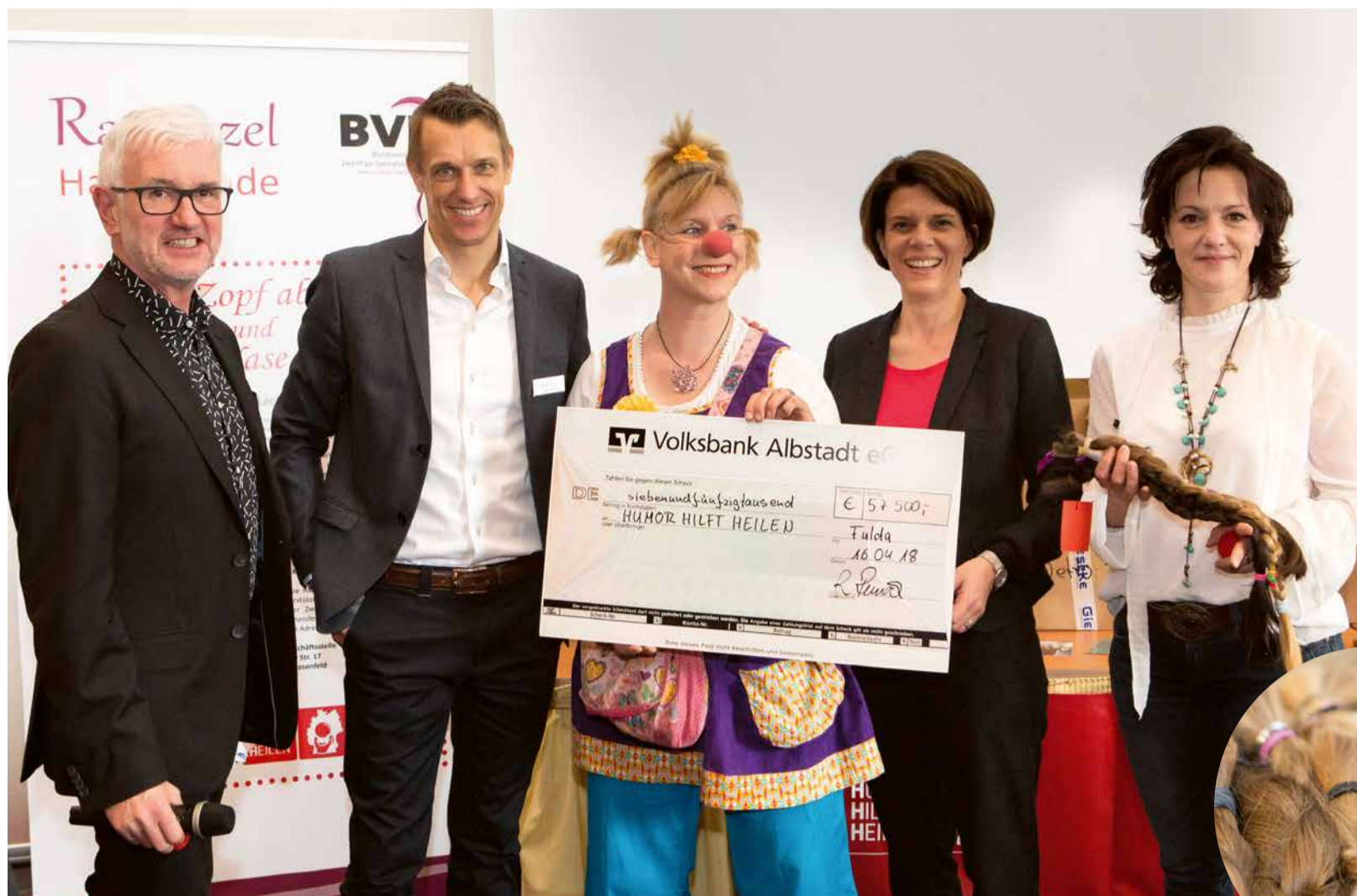
Gutes tun: Freude über die erfolgreiche und bisher größte Auktion von Haarspenden.