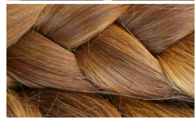
Aus gespendeten Zöpfen werden hochwertige Unikate: RAPUNZEL-25 von DENING HAIR.