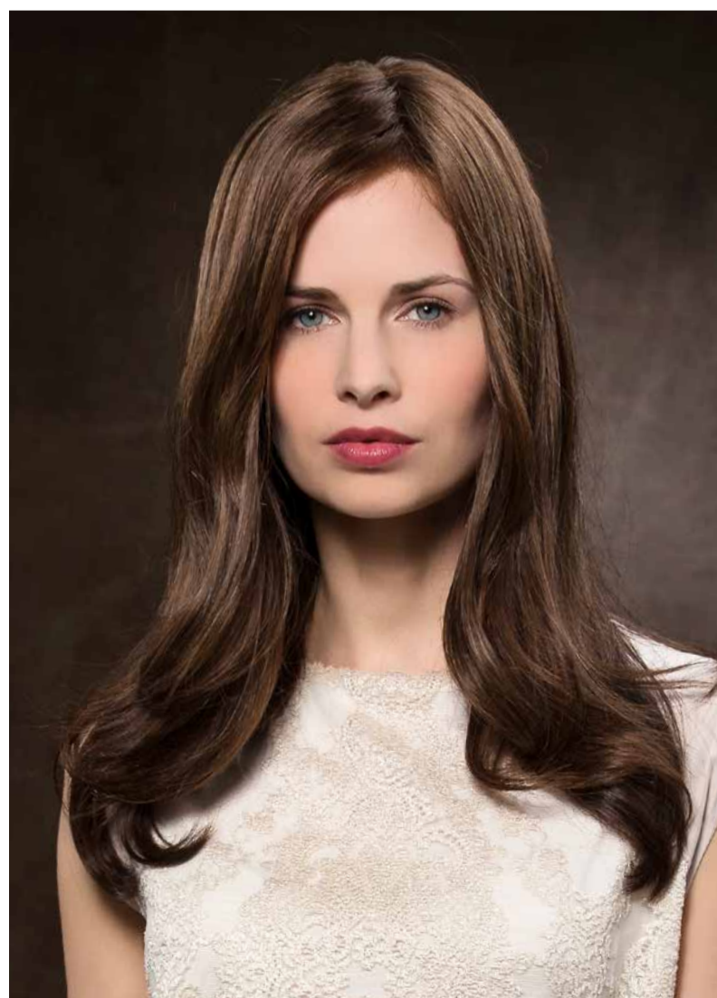
TRAVIATA RH 6/10-6