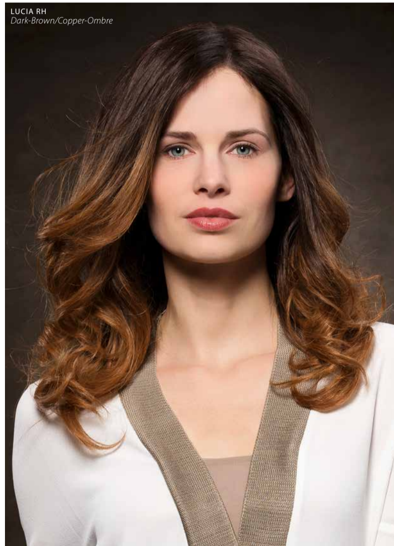
LUCIA RH Dark-Brown/Copper-Ombre