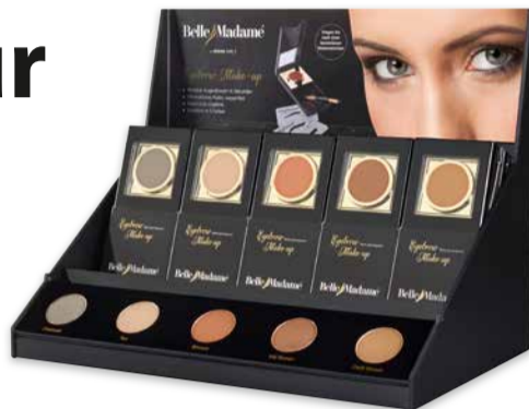
Display + 15 Augenbrauenpuder-Sets (5 Farben, 3 Sets je Farbe)

Mit dem BELLE MADAME EYEBROW MAKE-UP erweitert Dening Hair das BELLE MADAME Sortiment um ein hochkarätiges Kosmetikprodukt. Das BELLE MADAME EYEBROW MAKE-UP zaubert perfekt geschwungene Augenbrauen in Sekunden für bis zu 24 Stunden. Hiermit lassen sich im Handumdrehen genau die Augenbrauen kreieren, die man sich wünscht.