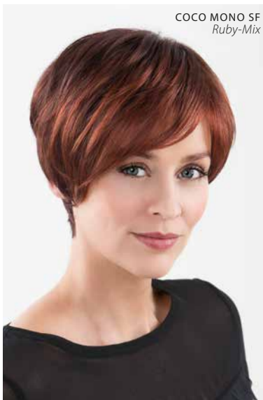
COCO MONO SF Ruby-Mix