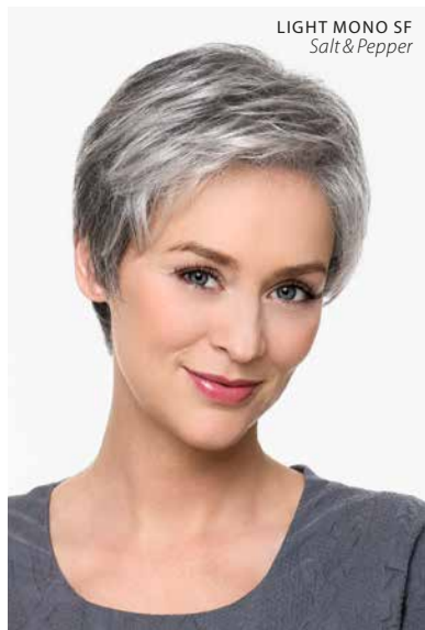
LIGHT MONO SF Salt & Pepper