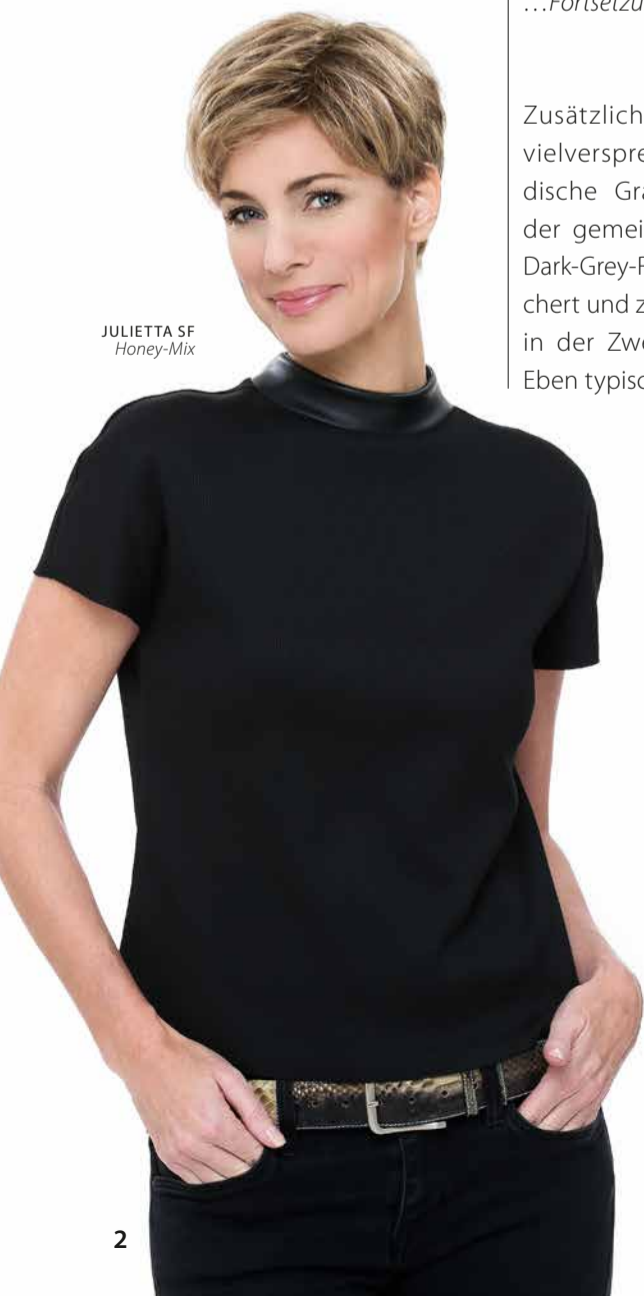
JULIETTA SF Honey-Mix

Neue Meisterwerke, beliebte Klassiker oder ganz einfach das persönliche Lieblingsmodell.