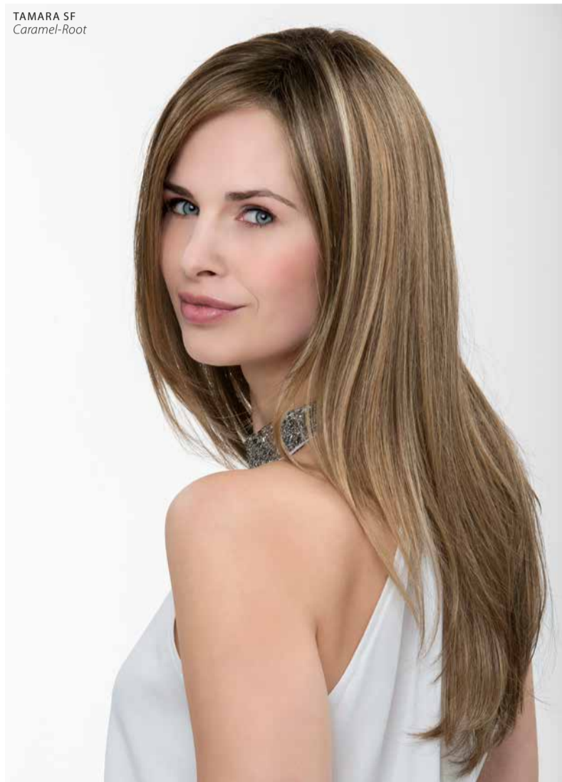
TAMARA SF Caramel-Root