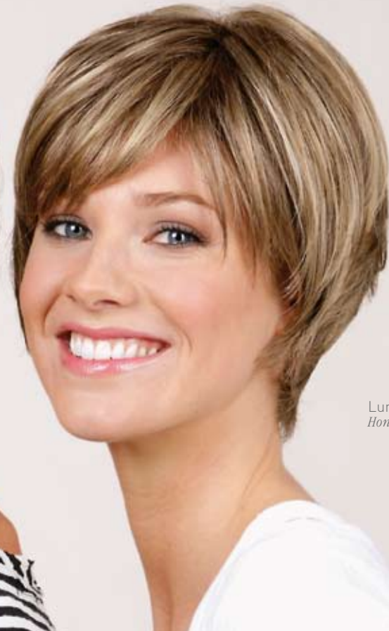
Luna Mono SF Honey-Toast