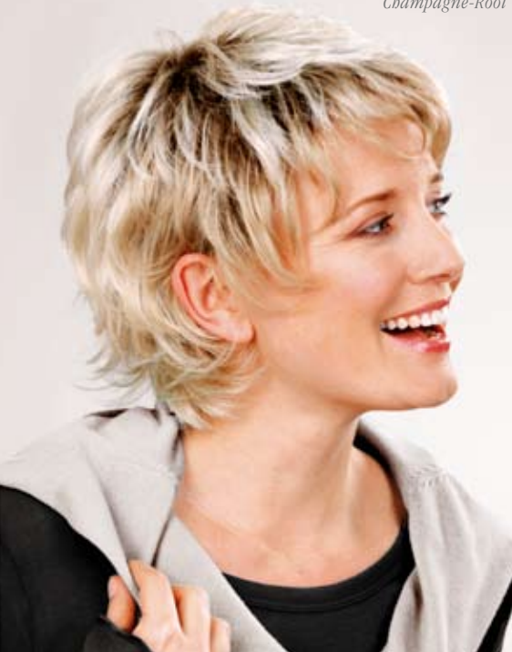
Power Mono Champagne-Root