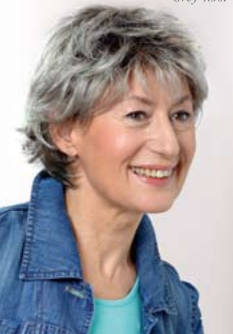
Ilona Mono SF Grey-Root