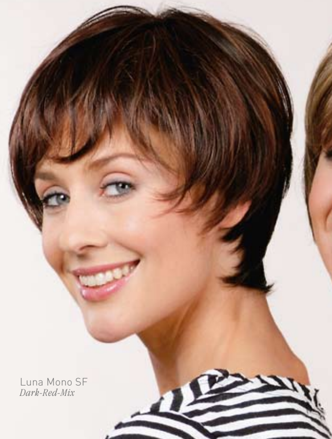
Luna Mono SF Dark-Red-Mix