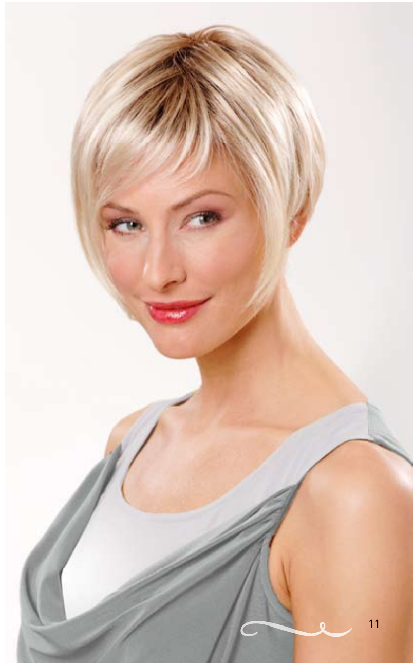
Vicky Mono SF Champagne-Mix-Root

Der speziell für Damenperücken entwickelte Ansatztüll ist weich und versinkt in der Haut. Die Knüpfttechnik am Ansatz ist so fein, dass die Haare wie gewachsen erscheinen.