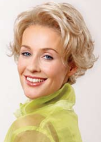
Mirja Mono SF Terracotta-Gold